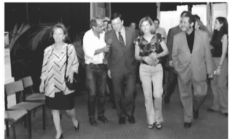
O Primeiro-Ministro e o Ministro da Cultura visitaram o Festival em 2002, tendo manifestado a sua admiração por esta iniciativa e prometido a continuação do apoio do Estado. Na foto estão também a Esposa do Primeiro-Ministro, a Presidente da Câmara de Almada e o director do Festival.