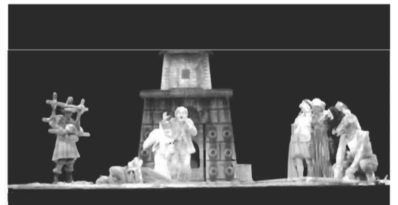
"O amor das três laranjas" , de Gozzi, com encenação de Benno Besson, o grande êxito de 2003.