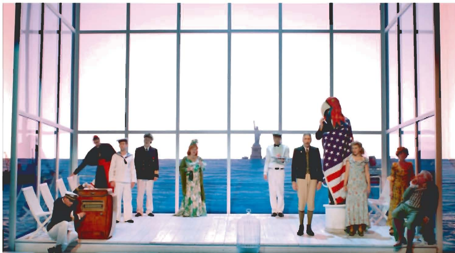
"Emmanuel Kant", de Thomas Bernhard, com direcção e interpretação de Roger Planchon.