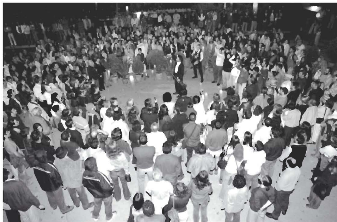
"Tangos e Tragédias": um grande êxito em 2003.

O público do Festival escolheu democraticamente, na edição passada, a produção que este ano acolheremos como Espectáculo de Honra 2004. Estamos a falar de Tangos e Tragédias , o espectáculo que já é considerado como um dos maiores êxitos de sempre do Festival de Almada.